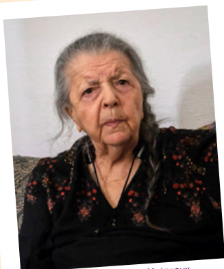
Madeleine Riffaud

Madeleine Riffaud (1924 - ) est l'une des rares femmes à avoir participé à la Résistance dans la lutte armée lorsque le 23 juillet 1944, à Paris, elle abat de sang-froid un grenadier nazi. Alors commence une course pour la survie jusqu'en 1945. Comme correspondante de guerre pour Ce Soir de Louis Aragon, pour L'Humanité aussi, celle qui fut l'épouse de Pierre Daix, l'amie des époux Aubrac, de Paul Eluard et de Picasso couvre ensuite les principaux théâtres de guerre. Reporter anticolonialiste et poète à la libre pensée, elle est une femme de lettres engagée, une des dernières sentinelles de notre mémoire, qui rappelle à travers son œuvre poétique et journalistique que la force de combattre rivalise pour chacun-e avec les tragédies de l'Histoire.