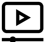
Graphiste : Freepick