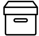
Graphiste : Pixel Perfect

Commander son kit de communication : vous pouvez commander auprès du Collectif des packs de communication comprenant les éléments précédemment cités à partir du formulaire d'inscription et les télécharger au format numérique.